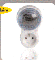
PROGRAMMATEUR DIGITAL HEBDOMADAIRE 3600 W maxi.