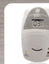
DÉTECTEUR AVERTISSEUR AUTONOME DE FUMÉE NORME EN 14604