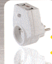
PRISE PROTÉGÉANT LES APPAREILS TÉLÉPHONIQUES et ses périphériques ainsi que leurs alimentations contre les risques de surtension.