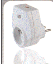
PRISE PROTÉGÉANT LES PETITS APPAREILS ÉLECTRIQUES contre les risques de surtension.