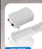
KIT 1 TÉLÉCOMMANDE 4 VOIES + 1 RÉCEPTEUR ÉTANCHE IP 44 Fonction : marche / arrêt. Puissance 1000 W.