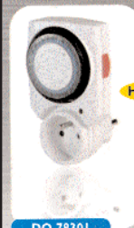
PROGRAMMATEUR MÉCANIQUE HEBDOMADAIRE 3300 W maxi.