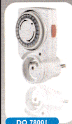
PROGRAMMATEUR MÉCANIQUE JOURNALIER 3680 W maxi.