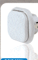
INTERRUPTEUR TÉLÉCOMMANDABLE mural à clicetron Variableur pour lampe à incandescence de 60 à 300 W.