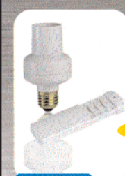
KIT 1 TÉLÉCOMMANDE 4 VOIES + 1 DOUILLE À VIS E 27 variableur pour lampe à incandescence de 60 à 300 W.