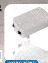
RÉCEPTEUR DANS BOÎTIER ÉTANCHE IP 44 Fonction : marche / arrêt. Puissance 1000 W.